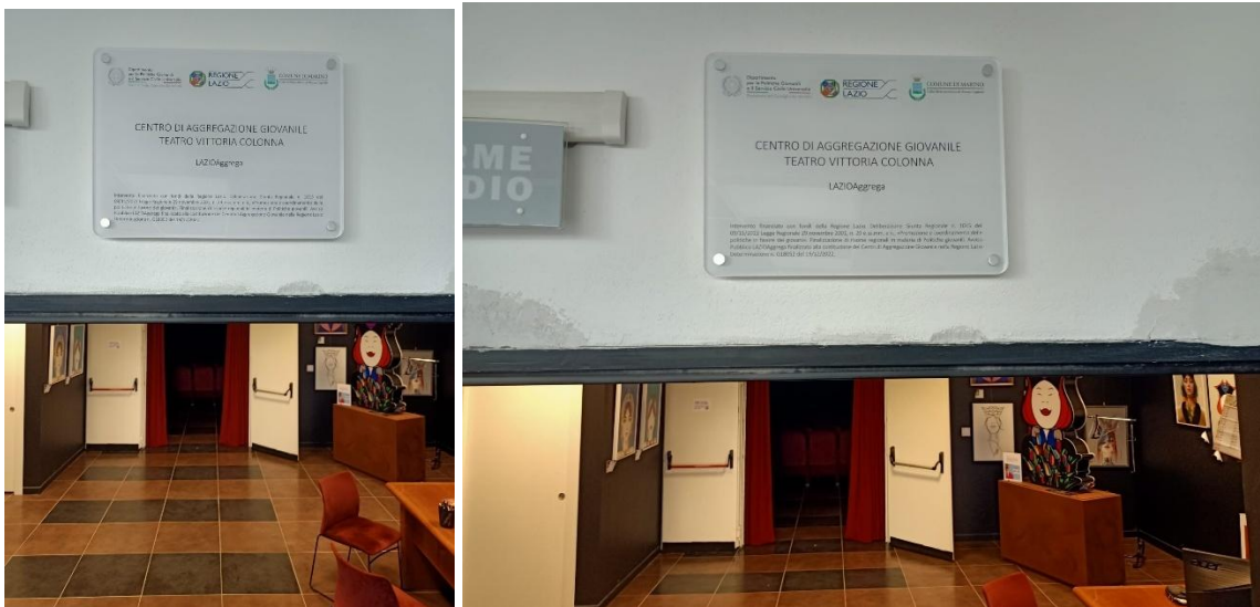
TARGA AFFISSA ALLA SALA LEPANTO